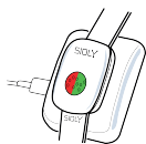
caricamento in corso

Per caricare il braccialetto collegalo alla basetta di ricarica, in modo che il punto rosso sul fondo del braccialetto tocchi il punto rosso sulla basetta.